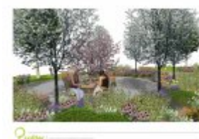
Architektura krajobrazu - wizualizacja 3