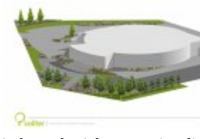
Architektura krajobrazu - wizualizacja 4

Należy podać minimalny procentowy wskaźnik