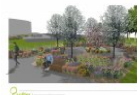
Architektura krajobrazu - wizualizacja 1

Ogłoszenie nr 504025-N-2019 z dnia 2019-01-16 r.