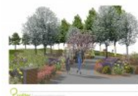
Architektura krajobrazu - wizualizacja 2